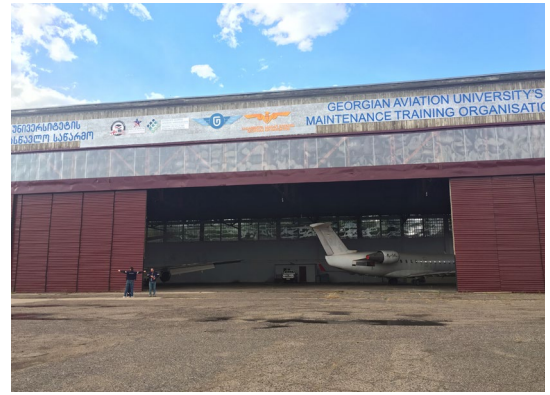
საქართველოს საავიაციო უნივერსიტეტის კუთვნილი საავიაციო ანგარის სურათი

კომპაქტის განხორციელების პერიოდში, PICG-ის ფარგლებში მხარდაჭერილი პროფესიული განათლების პროგრამებმა მოიზიდა დაახლოებით 6 მილიონი აშშ დოლარი კერძო სექტორისაგან თანაინვესტიციის სახით პროფესიული განათლების განხორციელებისათვის, რაც სამჯერ და მეტჯერ აღემატება კომპაქტის საწყის მიზანს და მიუთითებს ინდუსტრიების კმაყოფილების მაღალ დონეზე. პროფესიული განათლების პროგრამების პროვადერები აგრძელებდნენ გრანტის ფარგლებში მხარდაჭერილი პროგრამების შეთავაზებას პროექტის დასრულებიდან ორი წლის შემდეგაც. პროფესიული განათლების პროვადერების თითქმის ნახევარმა შეიმუშავა და გამოაცხადა მიღება ახალ პროგრამებზე, რომლებიც უკავშირდება PICG-ის მხარდაჭერილ პროგრამებს. სახელმწიფო ვაუჩერი სრულად ფარავს PICG -ის ფარგლებში შემუშავებულ პროგრამებს და მტკიცედ უჭერს მხარს მათ ფუნქციონირებას.